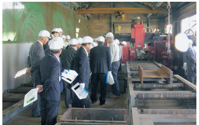
迫力の溶接現場、高い技術に感銘をうけました。