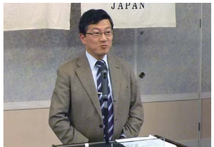
十勝経済の現況について、大変にわかりやすい内容のお話でした。データなどもあり説得力のある内容でした。