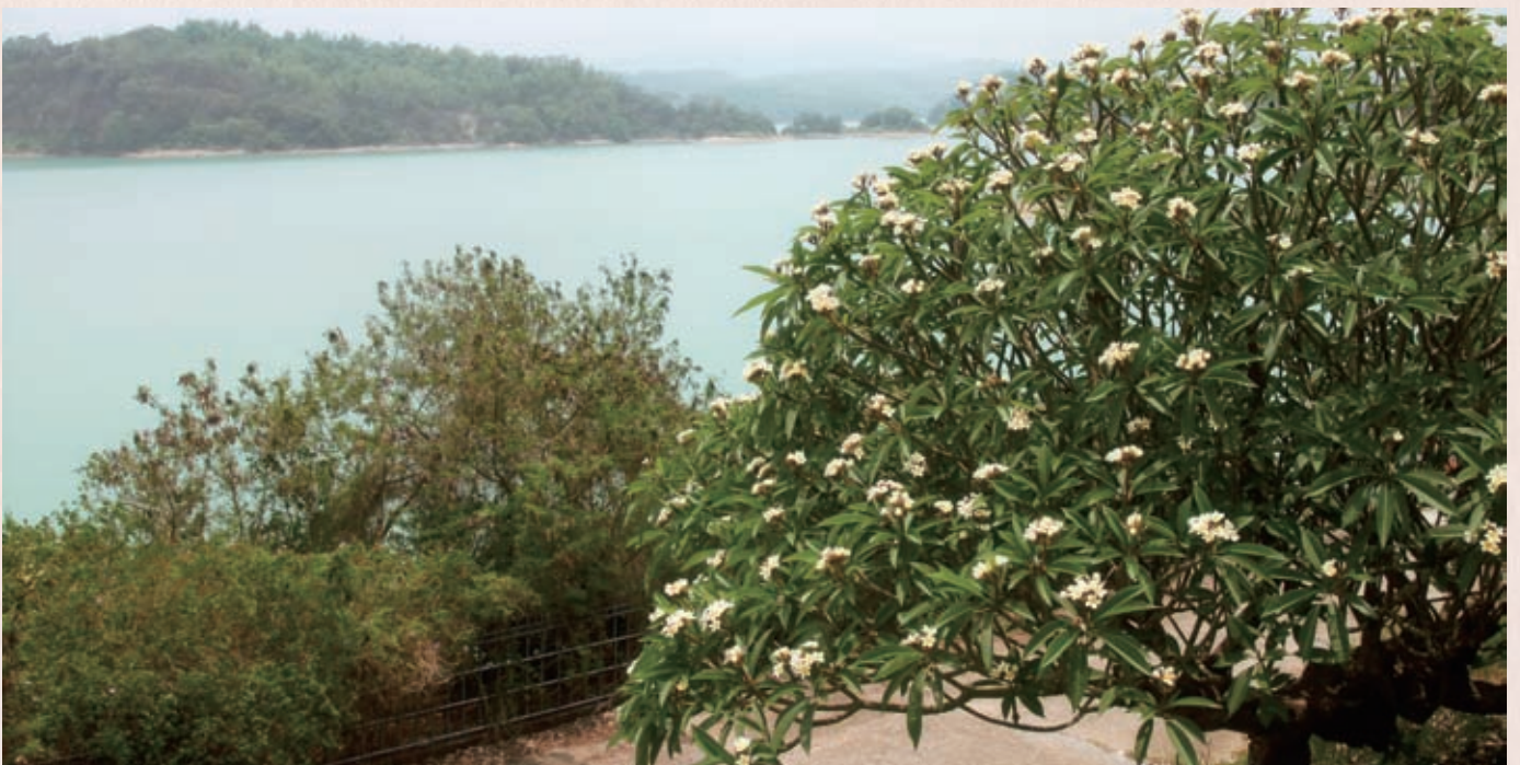
平成27年 5月 8日 台湾の烏山頭ダム湖を撮る 福岡正雄会員