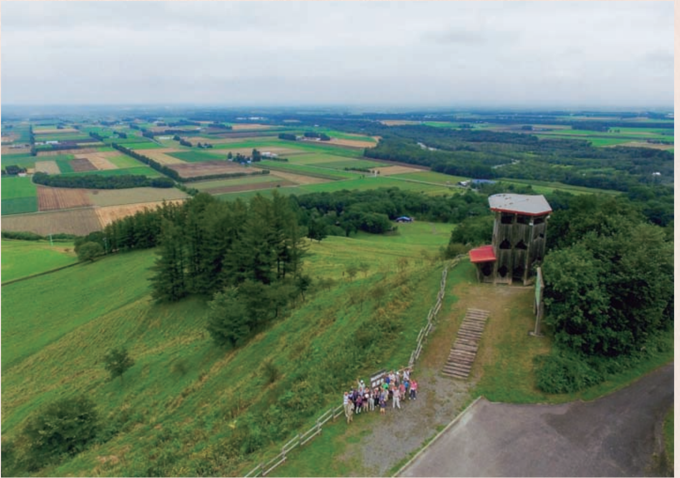
平成28年 8月28日 新嵐山スカイパークにて