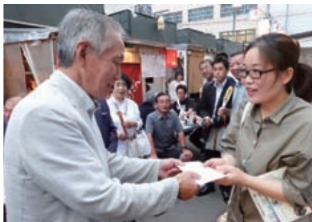
米山奨学生奨学金授与式