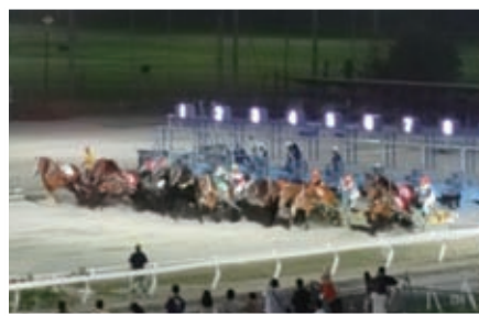
帯広東ロータリー主催の第9レーススタート